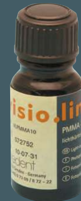
visio.lign REF VLP MMA1 0