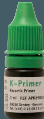
Primer K REF APK 2500 3