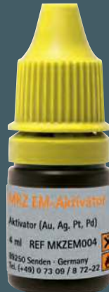
Attivatore MKZ EM REF MKZ EM00 4