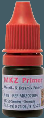
Primer MKZ REF MKZ 0200 4