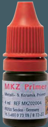
Primer MKZ REF MKZ 0200 4